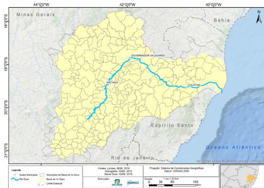
Figura 2 - Localização da Bacia Hidrográfica do Rio Doce

Pode ser considerada privilegiada, ainda, no que se refere à grande disponibilidade de recursos hídricos, mas há desigualdade entre as diferentes regiões da bacia. A Figura 2, a seguir, apresenta a delimitação da bacia hidrográfica do rio Doce.