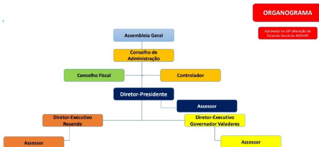
Figura 1 – Estrutura AGEVAP

A AGEVAP é formada por uma Assembleia Geral, um Conselho de Administração, um Conselho Fiscal e uma Diretoria Executiva. Os membros dos Conselhos de Administração e Fiscal são pessoas físicas eleitas pela Assembleia Geral. A Diretoria Executiva é composta por um Diretor Presidente, dois Diretores Executivos, três Assessores e um Controlador, como mostrado na Figura 1.