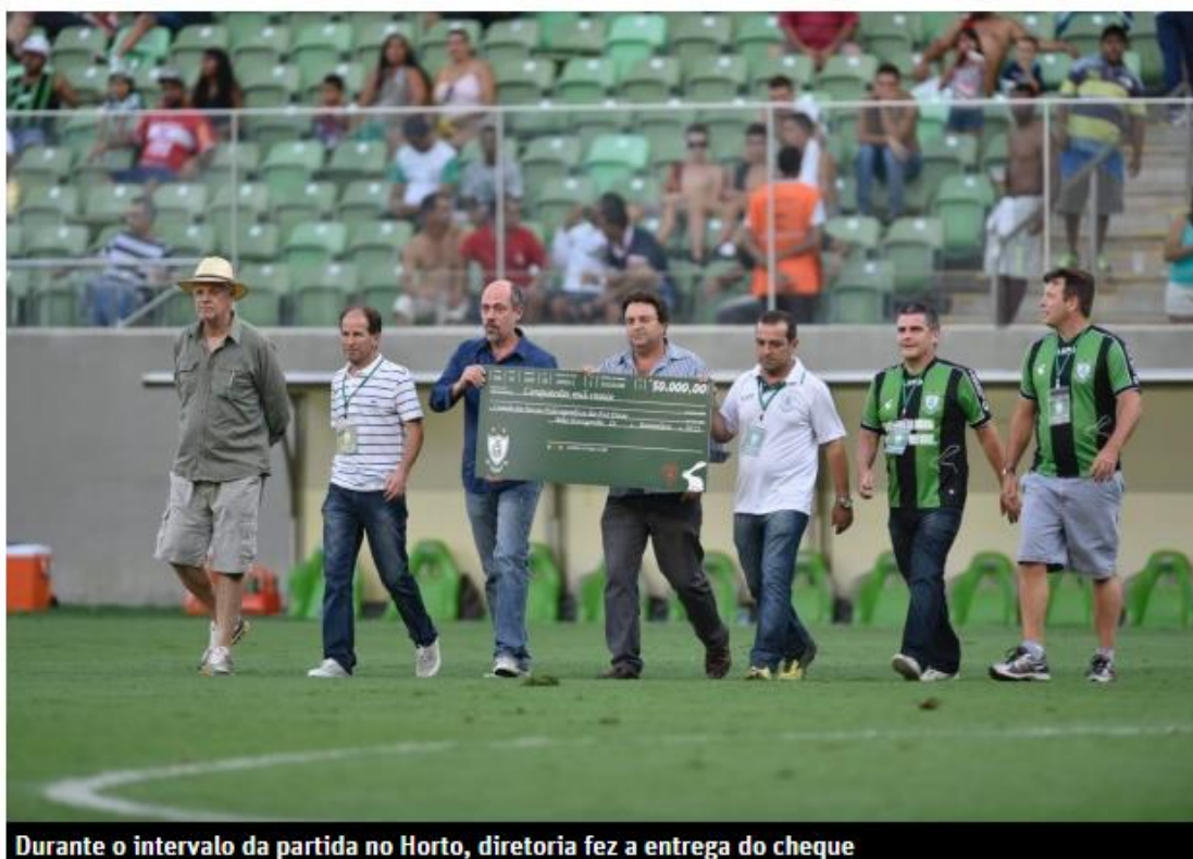
Durante o intervalo da partida no Horto, diretoria fez a entrega do cheque