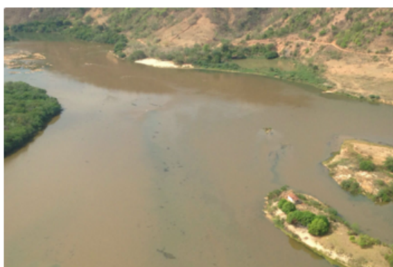
Lama percorre a calha do Rio Doce em direção ao ES

A onda de lama com rejeitos de minérios de ferro , que contaminou o Rio Doce após o rompimento das barragens da Samarco em Mariana (MG), ainda não chegou ao Espírito Santo , mas já se aproxima da divisa do Estado com Minas. À bordo do helicóptero Trovão Azul, a equipe de reportagem da TV Vitória/Record sobrevoou o leito do Rio Doce, na tarde desta segunda-feira (09), e conseguiu registrar sinais da lama no trecho do rio que passa pela cidade mineira de Resplendor, próximo ao limite com