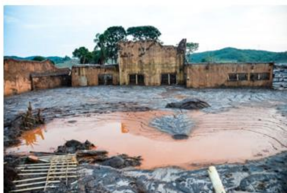
A empresa terá que fornecer água para moradores afetados pela enchente de lama

O Instituto Estadual de Meio Ambiente e Recursos Hídricos (IEMA) intimou a empresa Samarco em função dos impactos ambientais e socioeconômicos causados no Espírito Santo pela lama de rejeitos que atingiu o Rio Doce.