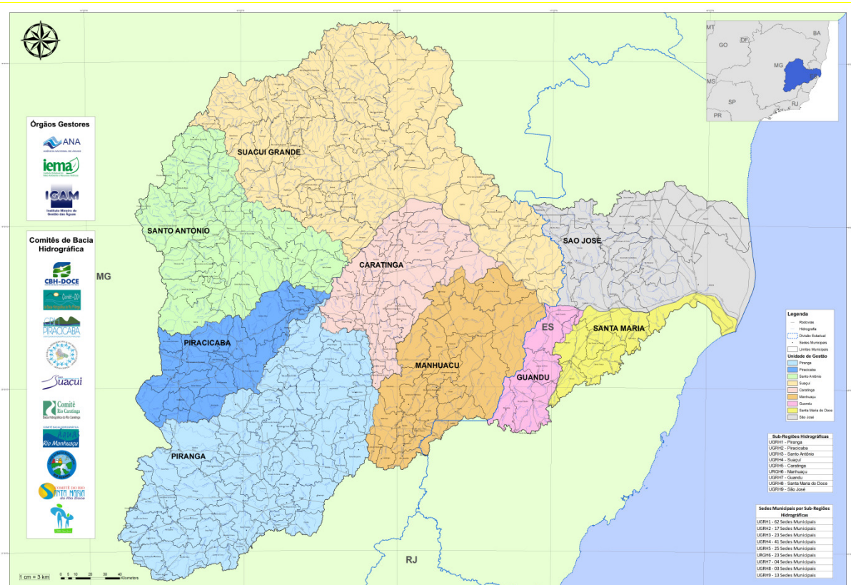
Figura 2.1 Localização da bacia do rio Doce

As nove unidades estaduais de gestão de recursos hídricos (UGRHs) da bacia contemplam as UGHR1 Piranga; UGHR 2 Piracicaba; UGHR 3 Santo Antônio; UGHR 4 Suaçuí; UGHR 5 Caratinga e UGHR 6 Manhuaçu, em Minas Gerais, e três no Espírito Santo, correspondente às UGHR 7 Guandu; UGHR 8 Santa Maria do Doce e UGHR 9 São José.