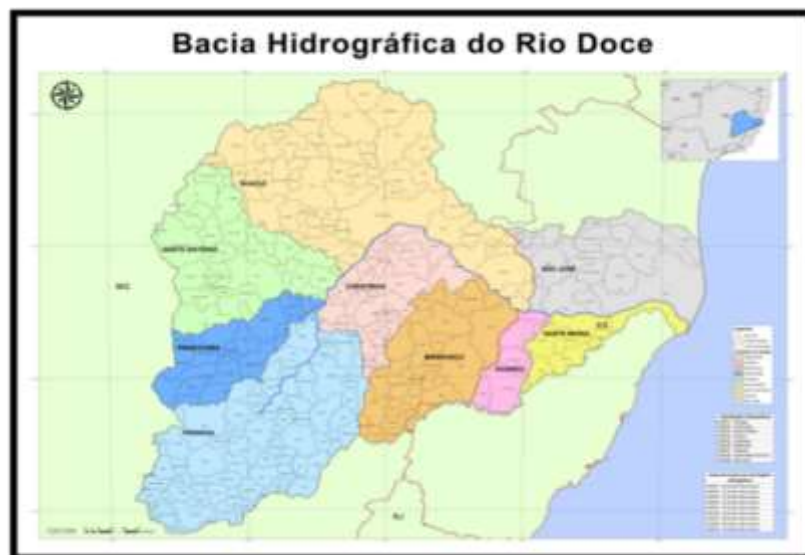
Figura 3 – Bacia Hidrográfica do Rio Doce

A figura 3, abaixo, apresenta a Bacia do Rio Doce e respectivos comitês de bacia tanto do Estado de Minas Gerais como do Estado do Espírito Santo.