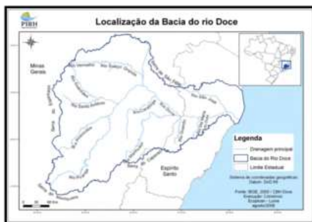
Figura 1 – Localização da Bacia Hidrográfica do Rio Doce

A Bacia limita-se ao sul com a Bacia Hidrográfica do Rio Paraíba do Sul, a sudoeste com a Bacia do Rio Grande, a oeste com a Bacia do Rio São Francisco, ao norte e noroeste com a Bacia do Rio Jequitinhonha, e bacias do litoral sul do Espírito Santo e a nordeste com as bacias do litoral norte do Espírito Santo.